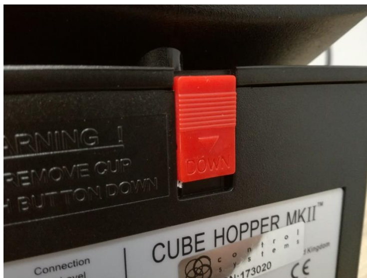
Rys. 1.5. Blokada nadstawki.