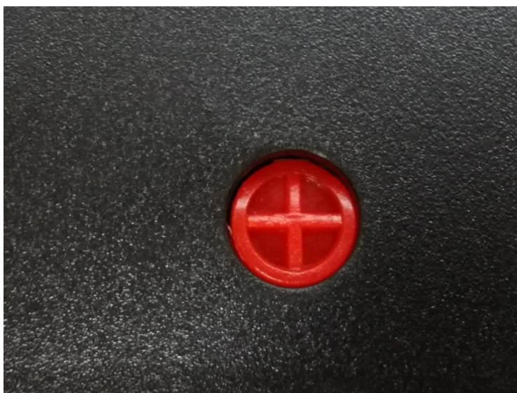
Rys. 1.2. Mocowanie hoppera.