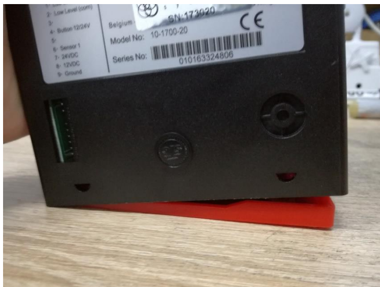
Rys. 1.4. Hopper po zwolnieniu blokady.