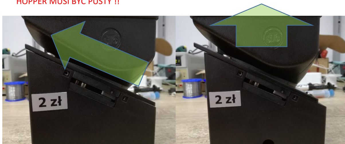
Rys. 1.6. Kierunek zdejmowania nadstawki.