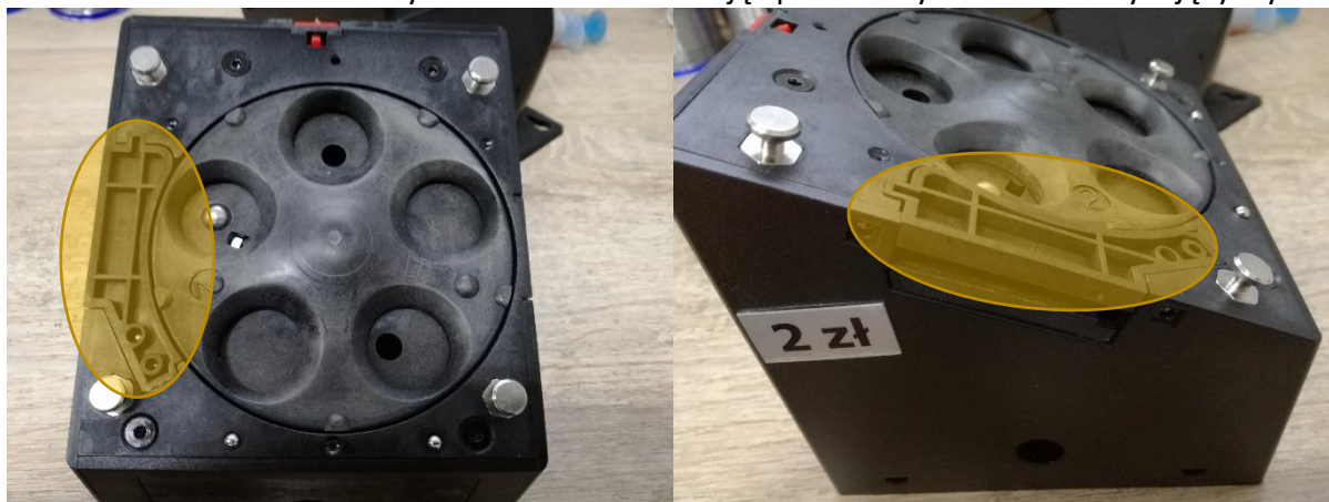
Rys. 1.7. Wylot monet.

7. W celu odblokowania wylotu monet można zdjąć plastikowy element zamykający wylot.