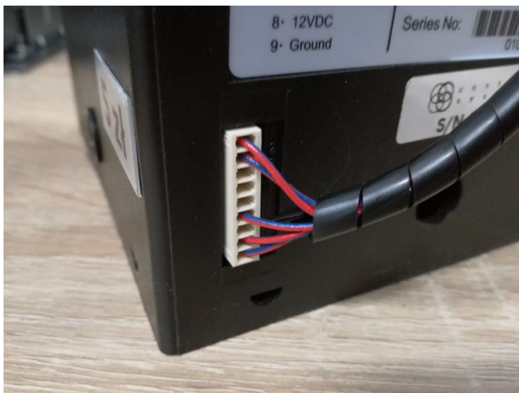
Rys. 1.1. Wtyczka przewodu do hopperów.