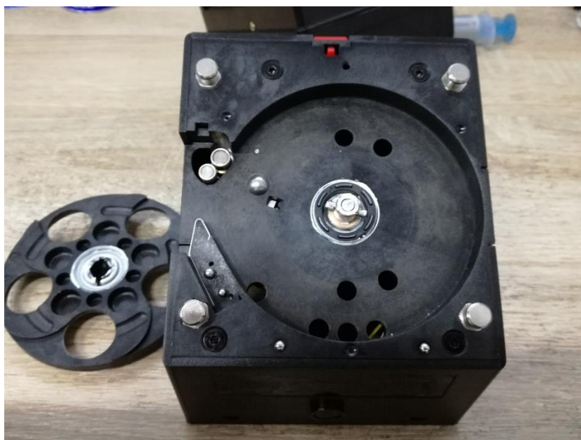
Rys. 1.8. Hopper z wyjętym dyskiem i blokadą wylotu monet.

8. Hopper należy wyczyścić głównie pod dyskiem – w tym celu dysk należy zdjąć poważając go lekko od spodu lub chwytając w miejscu okrągłych otworów.